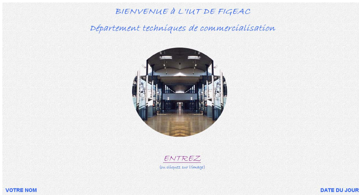
Figure 1 : Page « index.htm ».

La première page à réaliser est la suivante, elle s'appelle « index.htm »